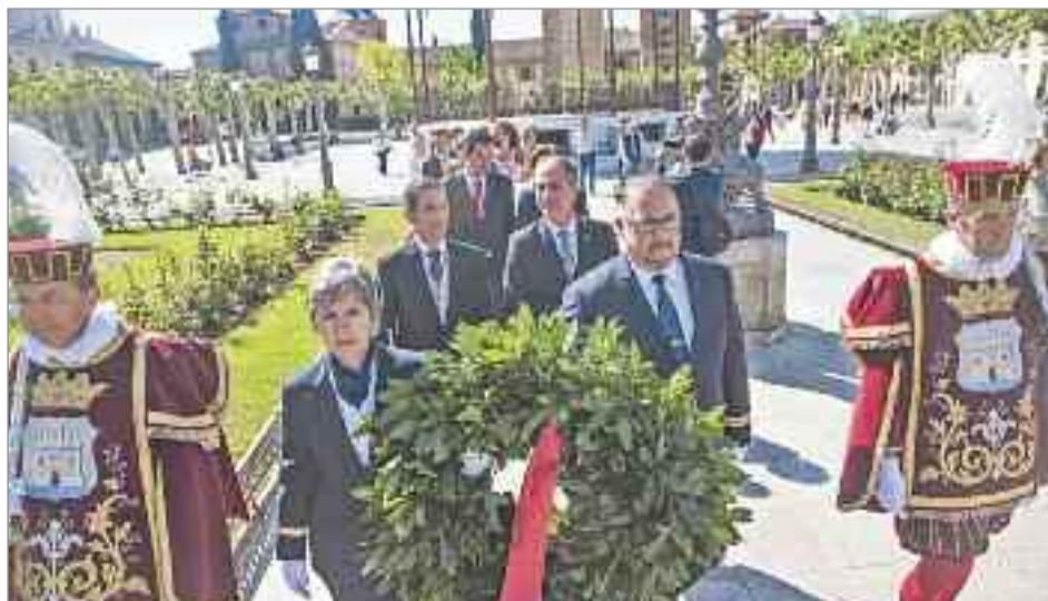
La corona de laurel fue trasladada procesión cívica desde la Casa Consistorial.