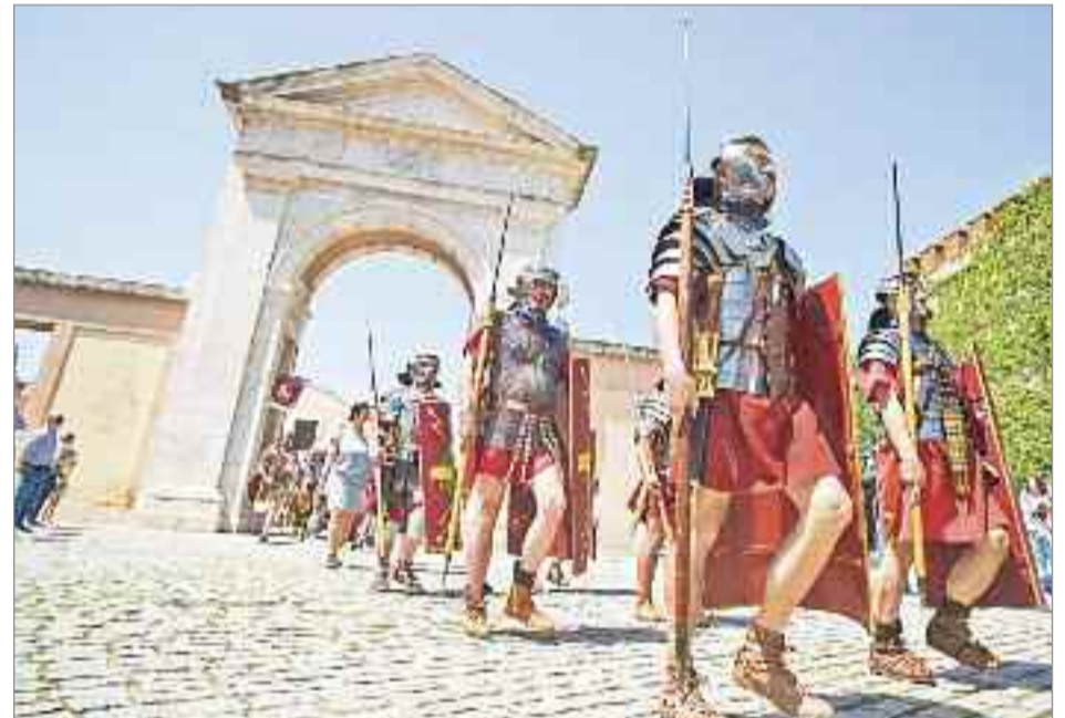
Alcalá volvió a acoger la celebración de Complutum Renacida, una vuelta al siglo IV y la época de los romanos

DE CAÑAS CON LOS ROMANOS 'De Cañas con los Romanos' volvió a ofrecer una charla distendida y abierta al público que versó año sobre 'Los romanos y el fin de la civilización'. Peleas de gladiadores, maniobras militares de la legión romana, condecoración a los héroes de Roma, vivir cómo era un proceso electoral en las ciudades del Imperio o cómo se combatían los peligros, los crímenes y desórdenes de la urbe fueron otras de las actividades programadas para público de todas las edades.