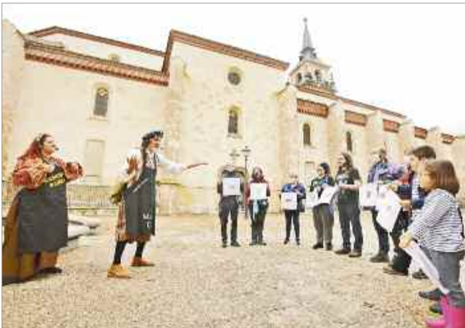
El Tren de Cervantes volverá a funcionar después del verano, del 16 de septiembre al 2 de diciembre