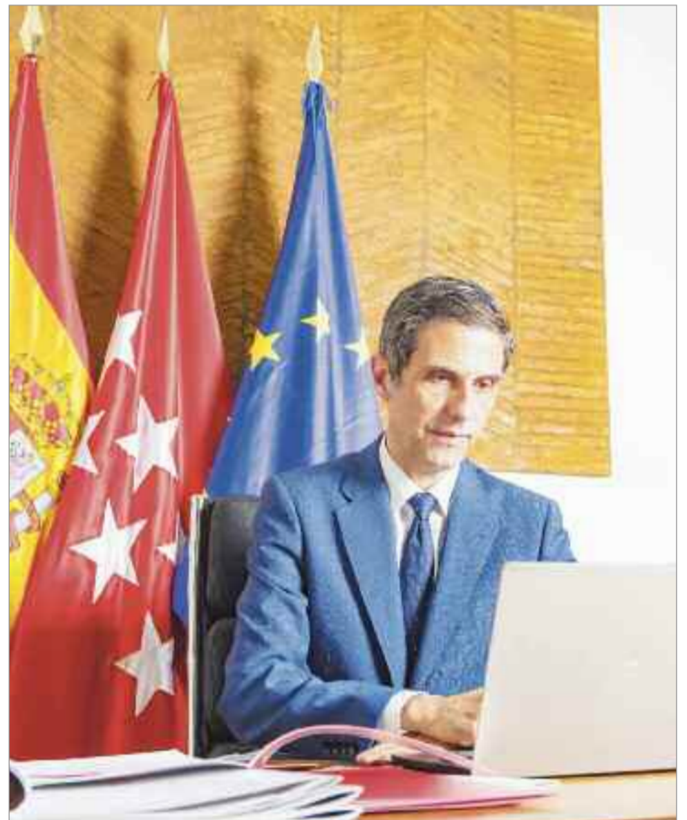
El alcalde de Alcalá de Henares está convencido de acercar los barrios al sur de la A 2, al casco histórico.

que tenemos homologado nuestro sistema informático de Defensa con el Centro Criptológico Nacional (CCN), que neutralizó el ataque nada más iniciarse por lo que el daño fue muy poco y pudimos estar operativos en solo un día.