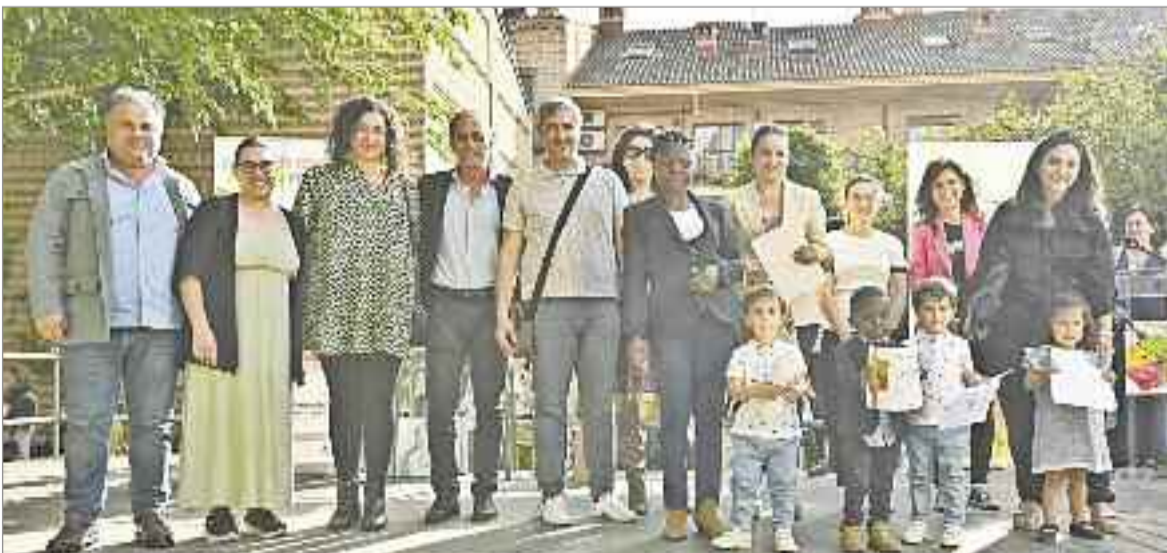
Es una exposición colectiva en la que han participado más de 2.000 escolares de un total de 28 centros educativos de la ciudad

•Por último, el Ayuntamiento recuerda que la Oficina de Atención al Consumidor (OMIC) está a disposición de las personas afectadas para asesorar ante cualquier reclamación que deseen interponer.