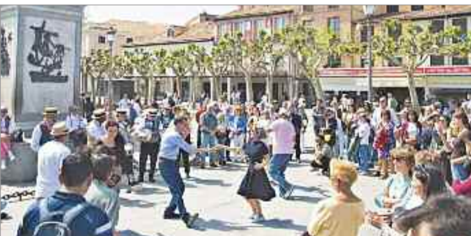
Con motivo de la apertura, actuó la "Spirits Jazz Band" en la propia Plaza de Cervantes de Alcalá de Henares