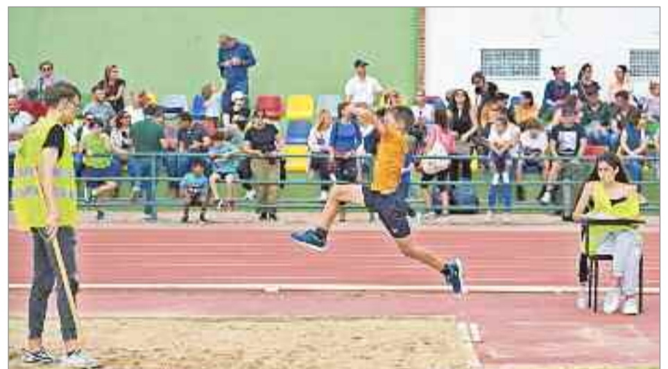
El atletismo fue otro de los protagonistas en el fin de semana deportivo de Alcalá de Henares