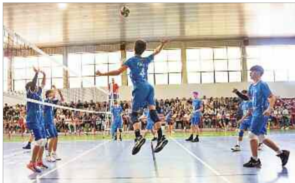
El equipo complutense finalizó en segunda posición tras una gran actuación de todo el equipo