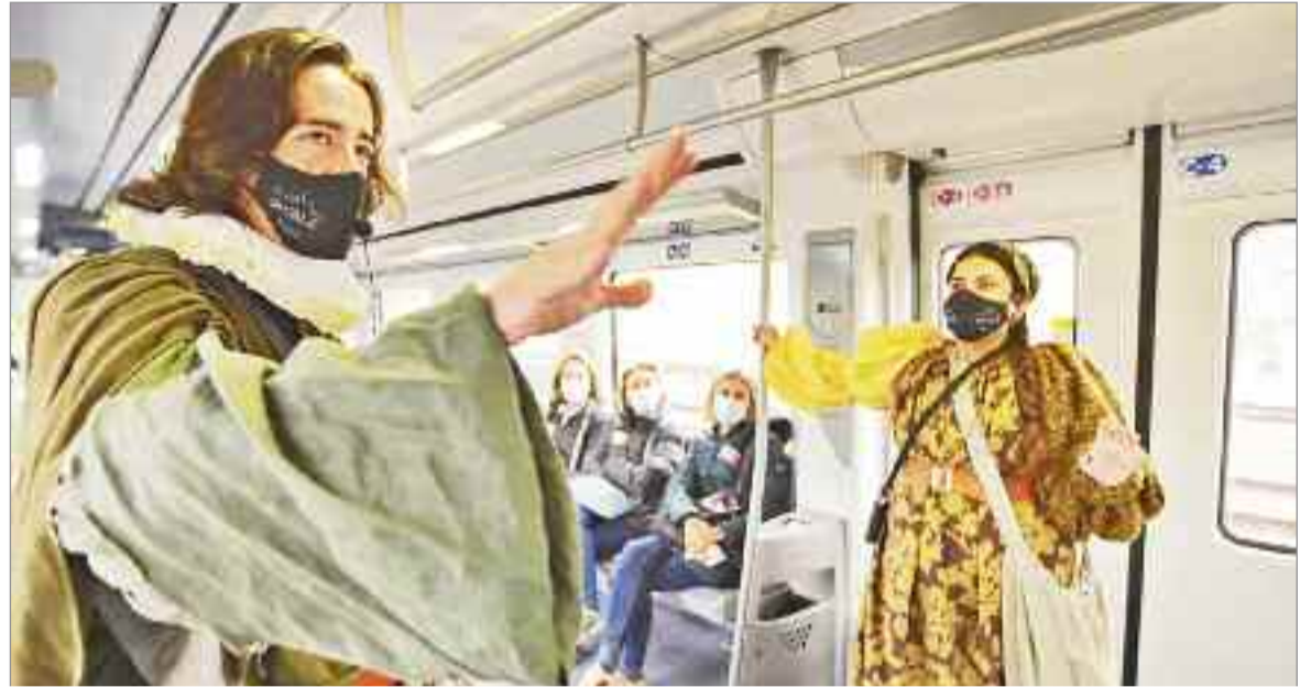
El tren partirá a las 10.20 horas de la estación Puerta de Atocha / Almudena Grandes, donde los viajeros serán recibidos por los personajes

El Tren de Cervantes volverá a transportar a los viajeros al Siglo de Oro todos los sábados hasta el 1 de julio. El tren partirá a las 10.20 horas de la estación Puerta de Atocha / Almudena Grandes, donde los viajeros serán recibidos por los personajes que los acompañarán hasta Alcalá de Henares, única Ciudad Patrimonio de la Humanidad de la Comunidad de Madrid. Con este son 26 los años que lleva en funcionamiento el Tren de Cervantes, una iniciativa fruto de la colaboración entre el Ayuntamiento de Alcalá de Henares, Renfe Viajeros, la Universidad de Alcalá de Henares y la Comunidad de Madrid. El precio del billete es de 22 euros por Adulto y 16 euros para niños, con edades de 7 a 11 años, y pueden adquirirse online en www.renfe.es . Además, Alcalá de Henares celebra los 25 años de su declaración como Ciudad Patrimonio de la Humanidad por la UNESCO. Un año en que la ciudad renueva su centro histórico, ampliando su zona peatonal y su oferta cultural y turística con mayor innovación y accesibilidad para quienes la visiten. El Tren de Cervantes volverá a funcionar después del verano, del 16 de septiembre al 2 de diciembre.