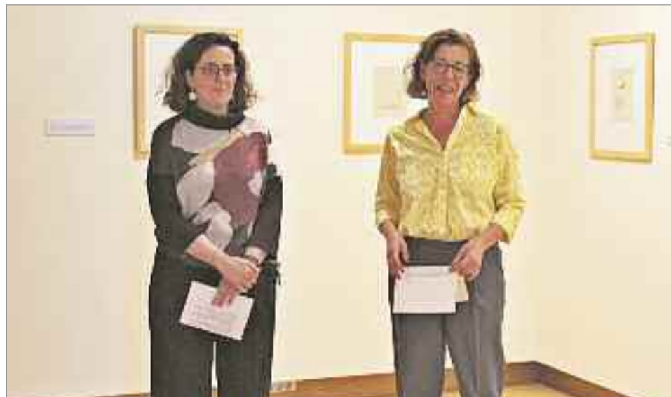
Los grandes maestros del siglo XX como Picasso, Óscar Domínguez, Jean Cocteau, Federico Castellón o Dalí están expuestos