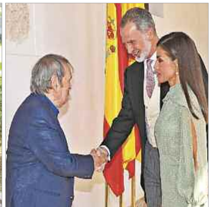
El Premio Cervantes 2022, el máximo galardón de las letras hispánicas