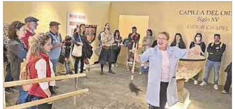
Con este son 26 los años que lleva en funcionamiento el Tren de Cervantes, una iniciativa fruto de la colaboración entre el Ayuntamiento de Alcalá de Henares, Renfe Viajeros, la Universidad de Alcalá de Henares y la CAM.