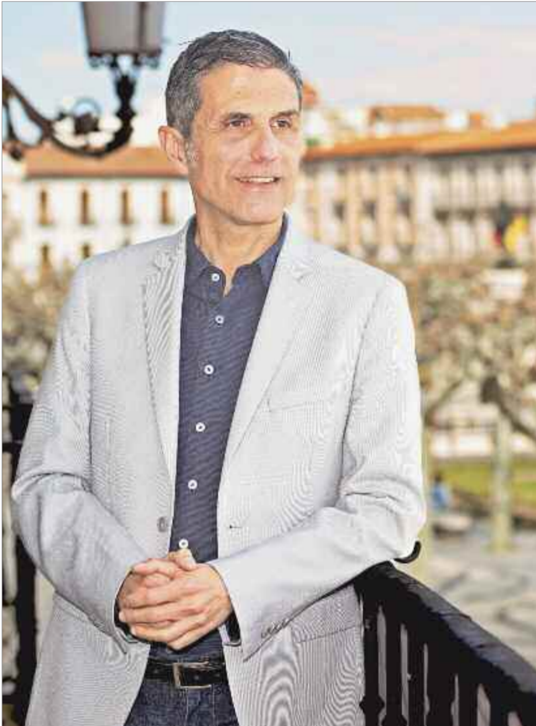
Para el alcalde el gran reto es que los cambios lleguen a todos los rincones de la ciudad.

Además, permitirá tener dotaciones necesarias para la ciudad, infraestructuras culturales, un aparcamiento con 1200 plazas y que ROCA continúe con una actividad económica, ya no ligada a una actividad fabril, pero si vinculada al conocimiento y a la innovación. Y además de todo ello, queremos utilizar parte de ese terreno como una opción residencial que permita financiar todo lo que le acabo de decir. Es la gran operación que necesita la ciudad para adaptar ese espacio que fue muy importante durante décadas, pero que hoy no tiene ninguna utilidad y queremos que recupere para la ciudad y para generar empleo.