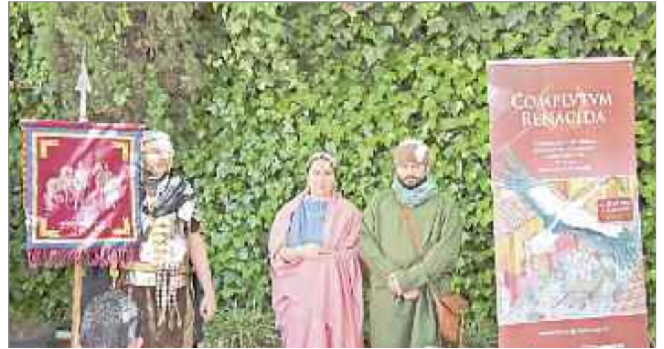
Complutum es uno de los yacimientos romanos más importantes del mundo

DE CAÑAS CON LOS ROMANOS 'De Cañas con los Romanos' volvió a ofrecer una charla distendida y abierta al público que versó año sobre 'Los romanos y el fin de la civilización'. Peleas de gladiadores, maniobras militares de la legión romana, condecoración a los héroes de Roma, vivir cómo era un proceso electoral en las ciudades del Imperio o cómo se combatían los peligros, los crímenes y desórdenes de la urbe fueron otras de las actividades programadas para público de todas las edades.