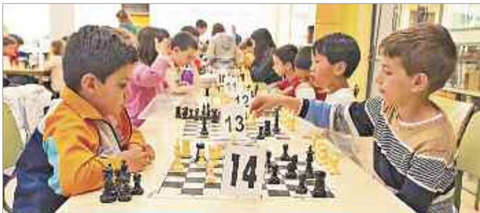
Alcalá tiene una gran cantera de jugadores de ajedrez y brillaron en la IV Jornada del Circuito Interescolar de Ajedrez

El programa comenzó con la celebración de una nueva jornada de deporte escolar en la modalidad de atletismo en pista, que contó con una gran participación y estuvo organizada por el Club de Atletismo Ajalkalá. También se disputó el primero de los partidos del Club Deportivo Iplacea Juvenil Masculino en la Fase Final del Sector madrileño, que acabó con