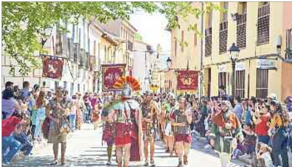
Más de 120 recreadores procedentes de todos los puntos de España llegaron a Alcalá para este evento

UNA CALLE ROMANA Esta tercera edición de Complutum incluyó novedades con las que se pretende hacer crecer su calidad. Así, más de 120 recreadores procedentes de todos los puntos de España llegaron a Alcalá para este evento, en el que por primera vez hubo una calle romana, una calle con su taberna, su alojamiento y su letrina, similar a la que existía en la Casa de los Grifos.