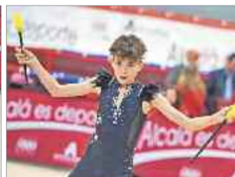
El Pabellón Demetrio Lozano - El Val reunió a cientos de gimnastas tanto en categorías masculina como femenina