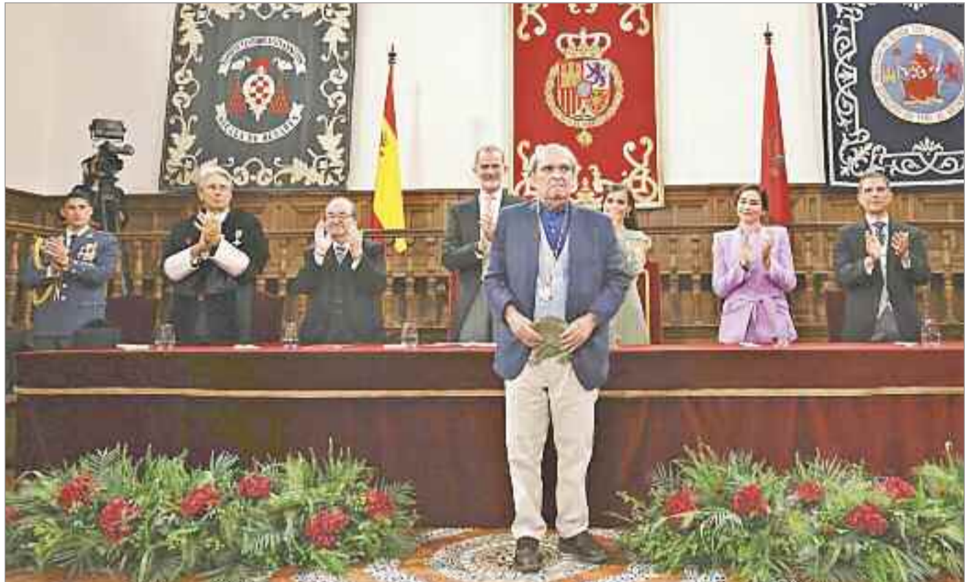
El poeta venezolano Rafael Cadenas recibió en el Paraninfo de la Universidad de Alcalá de Henares el Premio Cervantes 2022