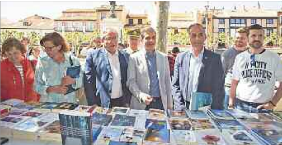
El alcalde, el vicealcalde, la concejala de Cultura, la teniente de alcalde, y varios concejales recorrieron la Feria

Se abrió al público la XL edición de la tradicional Feria del Libro de Alcalá de Henares, que contó con la presencia de destacados nombres de la literatura española contemporánea. Con motivo de la apertura, actuó la "Spirits Jazz Band" en la propia Plaza de Cervantes; un grupo de jazz tradicional que ha participado en multitud de festivales.