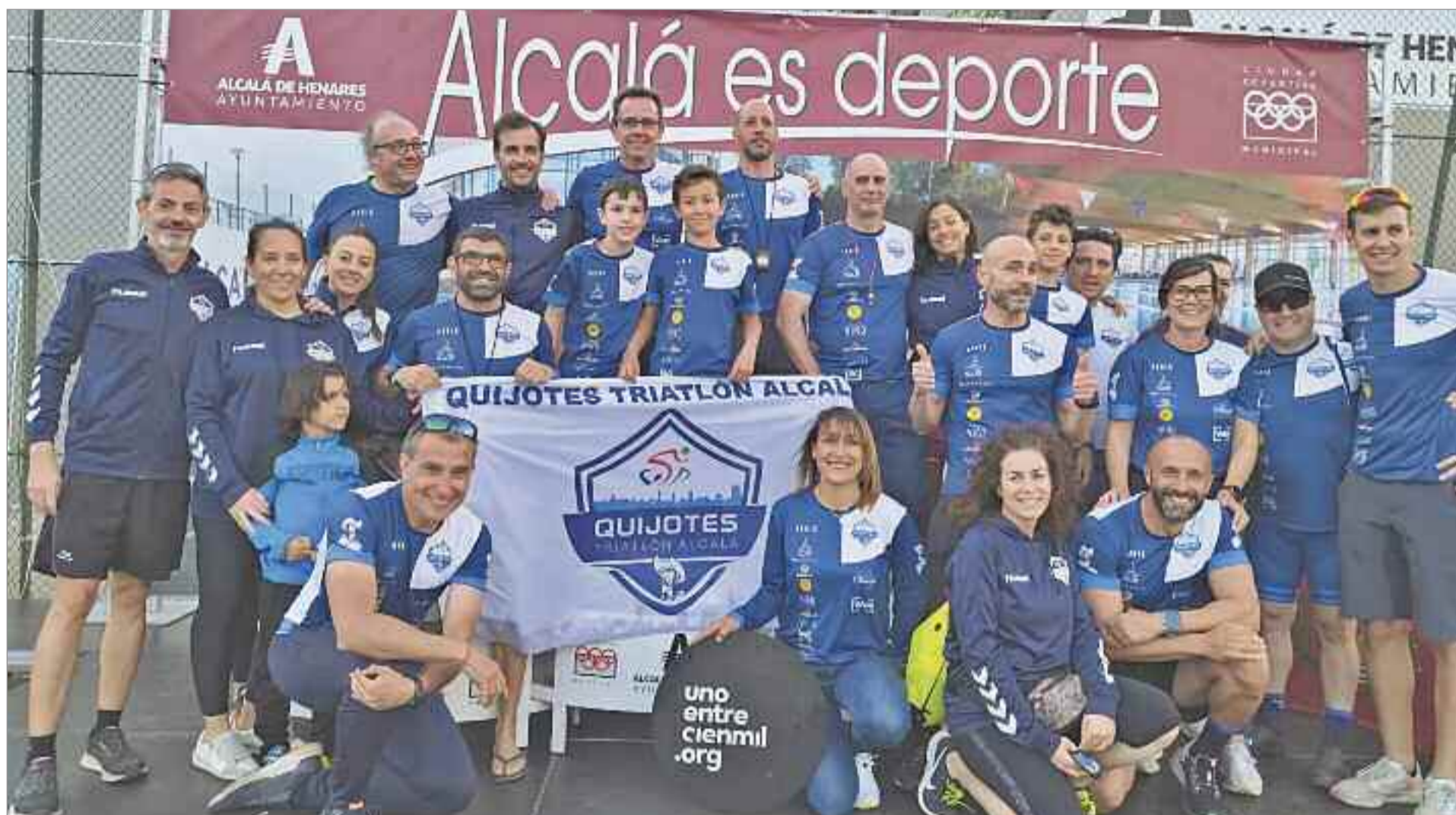
En la Piscina Cubierta de la Ciudad Deportiva Municipal del Val y el entorno del río Henares, tuvo lugar la segunda edición del Acuatlón Quijotes Triatlón Alcalá, organizado por el equipo Quijotes

En la Piscina Cubierta de la Ciudad Deportiva Municipal del Val y el entorno del río Henares, tuvo lugar la segunda edición del Acuatlón Quijotes Triatlón Alcalá. Una prueba que repite su novedoso formato en la ciudad complutense, en el que los participantes realizaron carreras por tandas primero en la piscina cubierta del Val para posteriormente calzarse las zapatillas de correr y disfrutar de un recorrido a través del corredor ecofluvial del río Henares. La organización corrió a cargo del Quijotes Triatlón Alcalá, promotor de la competición, y consistió en un total de 400 metros de natación y 6 kilómetros de carrera a pie, con la principal novedad este año de participar en la prueba por relevos y relevos mixto.