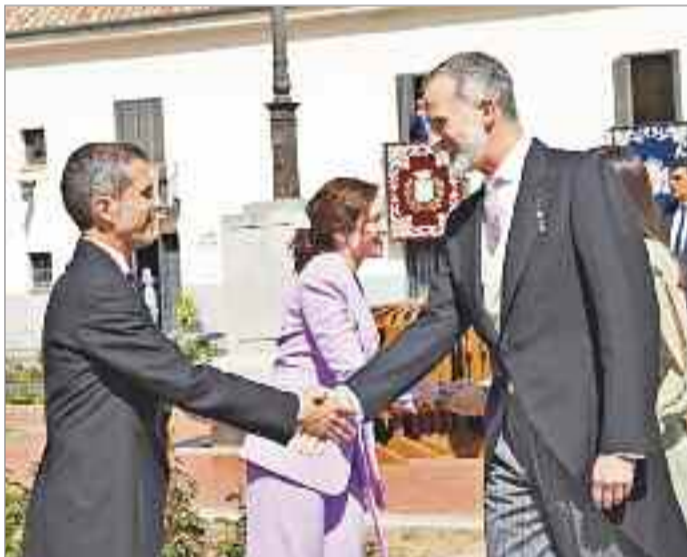
El Premio Cervantes estuvo presidido por SS MM Los Reyes de España