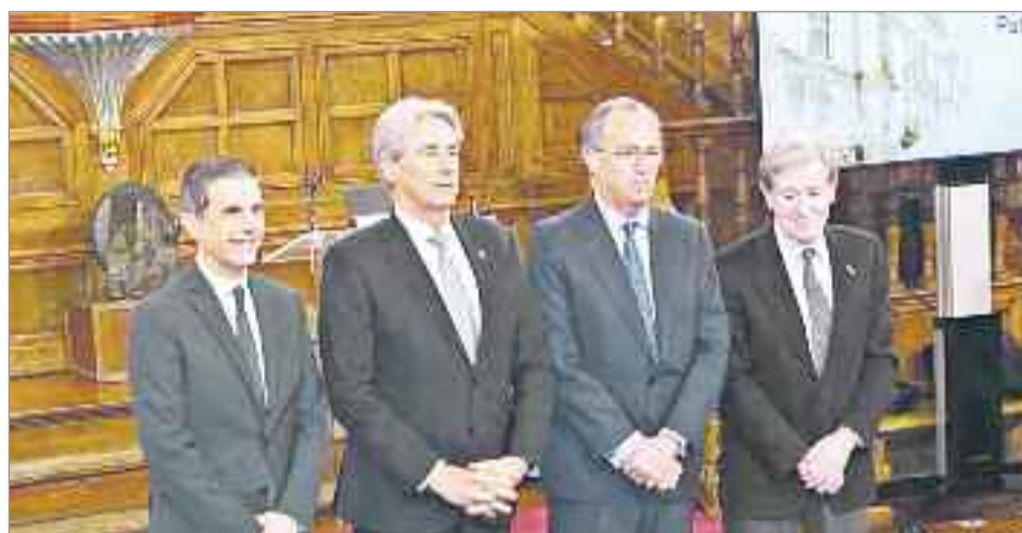
Gracias a la Sociedad de Condueños, fundada en 1851, hoy se puede disfrutar de la manzana universitaria

Toda esa trayectoria les valió para que el Pleno del Ayuntamiento de Alcalá de Henares nombrara Hija Predilecta de la Ciudad a la 'Sociedad de Condueños de los