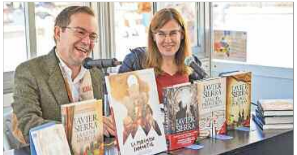
La Feria contó con la presencia de Javier Sierra, escritor y periodista, entre los autores españoles más vendidos